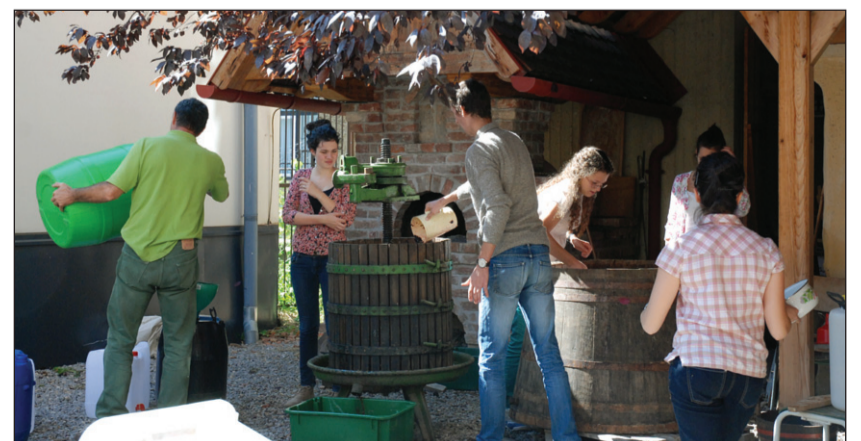
Most nem a tudást, a szőlőt préselik