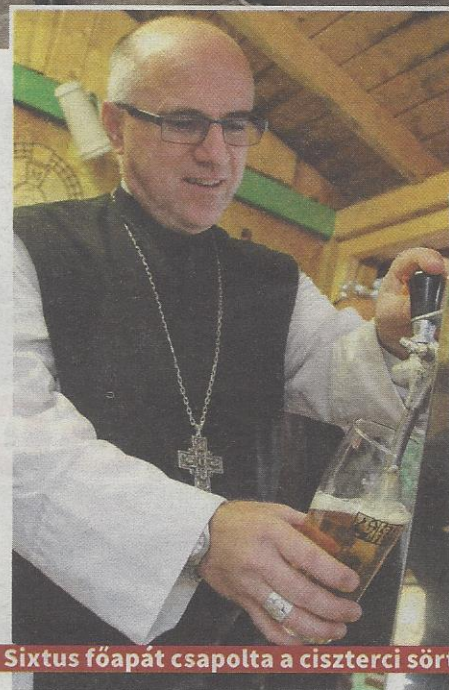
Sixtus főapát csapolta a ciszterci sört

– Jogásznak készültem, de ez lett belőlem. Mégpedig azért, mert már a